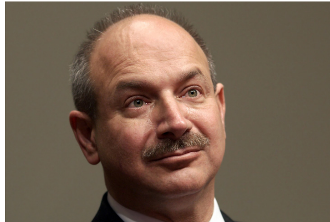
Prof. Dr. Bruce Beutler