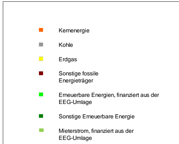
Stromerzeugung 2019 in Deutschland - Durchschnittswerte zum Vergleich