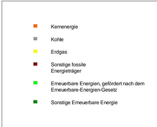
Stromerzeugung 2015 in Deutschland - Durchschnittswerte zum Vergleich