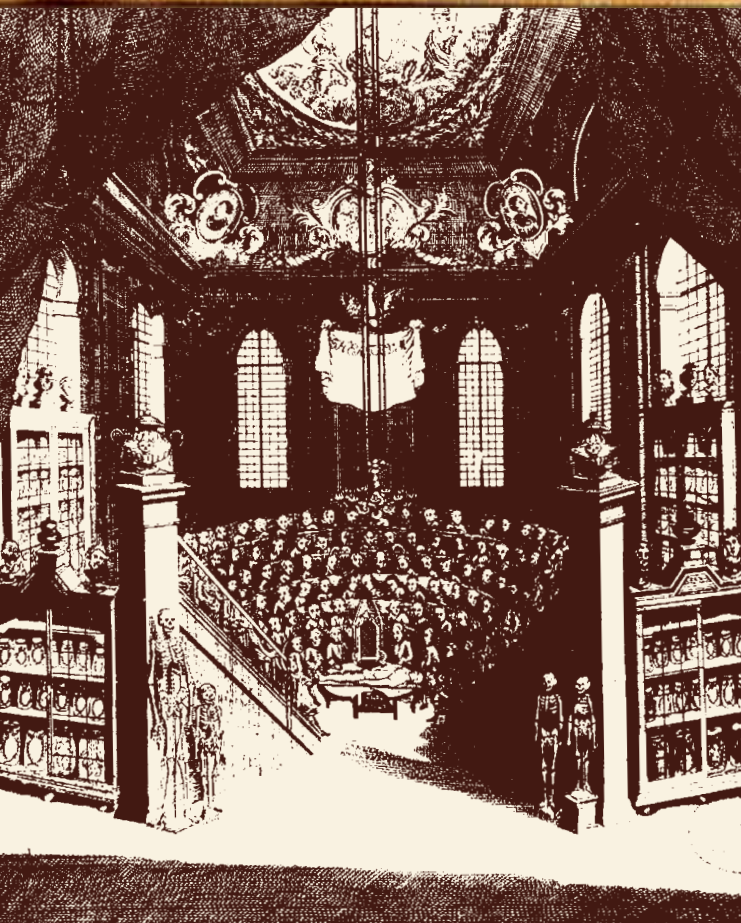
Theatrum anatomicum Berolinense.