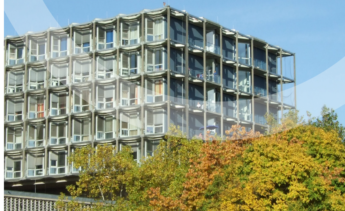
Layout und Foto: AS, Zentrale, Mediendienstleistungen Charité | CC15 | (siehe umzug.indd)