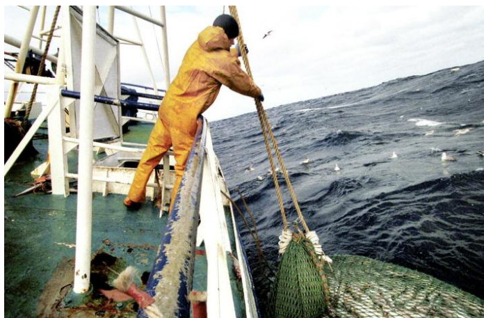
Schleppnetzfischer in der Nordsee